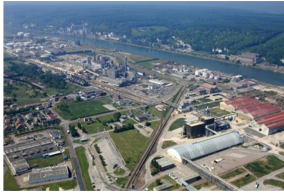
Borealis Grand Quevilly