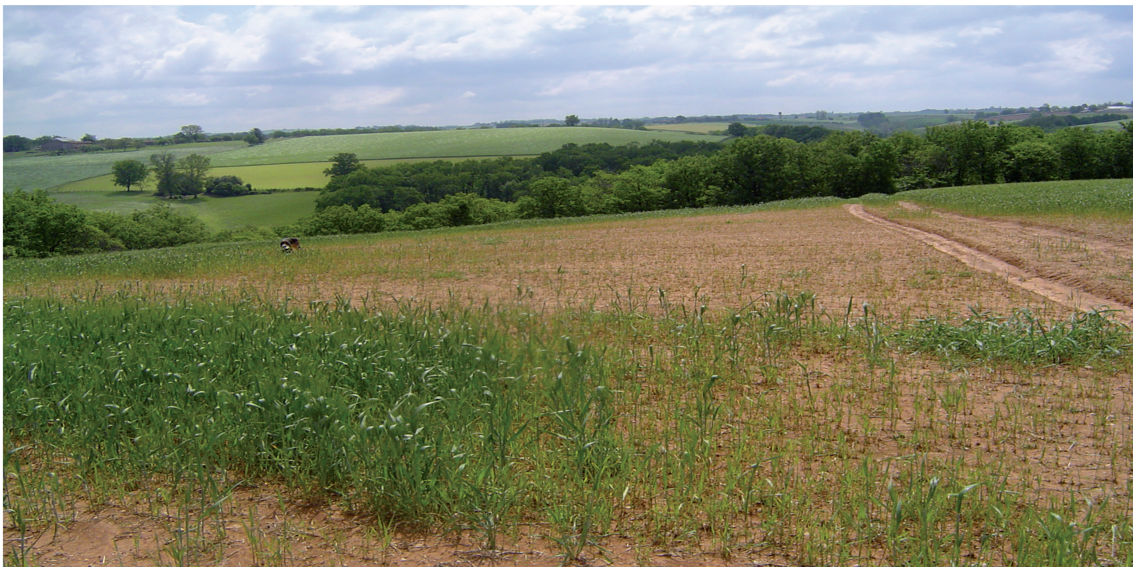
Toxicité aluminique sur blé

Sols acide à fort pouvoir fixateur en P 2 O 5 Sans aucun apport phosphaté