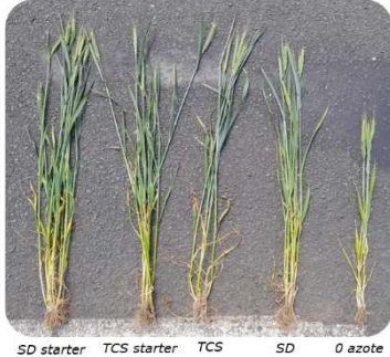
Photo 1 : Exemple de comparaison (à une date) de plantes selon différentes modalités sur la plateforme ACS conventionnel, système polyculture élevage

Suite à la première année de l'observatoire de pratiques, des plateformes expérimentales ont été mises en œuvre afin de pouvoir évaluer de manière plus précise les pratiques identifiées dans l'observatoire et objectiver i) l'impact de certaines stratégies innovantes de gestion de la nutrition de la plante au semis ou en végétation, mais également pour ii) évaluer le rôle des légumineuses de service dans la nutrition la culture du blé.